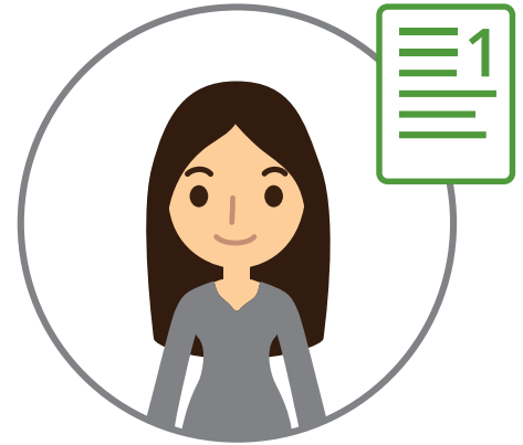
Lisa, 35 år

Notér hva som er bra og tips til forbedring